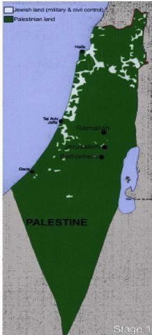
Palestinian and Jewish land 1946